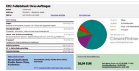
Berechnungsergebnis bei rsKalk rs Softwareentwicklung

Ihre Software errechnet bei der Kalkulation eines Druckprodukts automatisch dessen CO 2 -Emissionen. Auf dem Angebot werden diese zusammen mit den Kosten für eine CO 2 -Kompensation über ein anerkanntes Klimaschutzprojekt ausgewiesen. Entscheidet sich der Kunde für eine klimaneutrale Produktion, kann der Kompensationsauftrag direkt aus der Auftragsverwaltung bestellt werden. Label und Zertifikat werden als Link zur Verfügung gestellt, welche dem Kunden direkt weitergeleitet werden können. Dies alles erfolgt automatisch durch die von ClimatePartner realisierte Schnittstelle zwischen der Kalkulationssoftware und dem Footprint Manager – ohne Doppelerfassung der Daten. Klimaschutz lässt sich somit ohne Mehraufwand in die tägliche Arbeit integrieren.